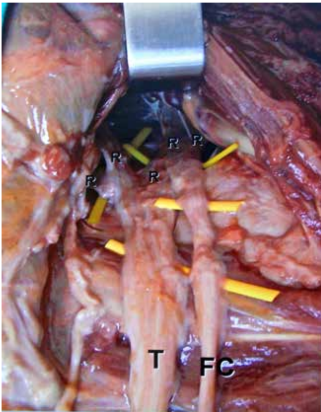
Figura 1 – Dissecção da região glútea do caso 1, observando-se os nervos tibial (T) e fibular comum (FC) independentes e suas raízes (R), com ausência do nervo ciático.

Apesar da variabilidade do local de divisão, nenhum dos artigos encontrados refere casos de ausência de nervo ciático, com origem e trajecto independente dos nervos tibial e fibular comum. Okraszewska, investigou as variações topográficas do nervo, referindo um caso em que o nervo tibial e fibular comum passam já isolados um do outro, inferiormente ao músculo piriforme. Contudo, não especifica se