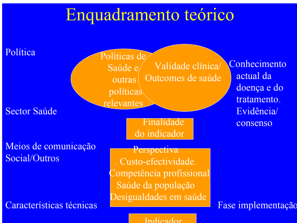
Perera, R.; Dowell, T.; Crampton, P.; Kearns, R. (2007)

Será difícil avaliar a actividade do centro de saúde, com base neste in-